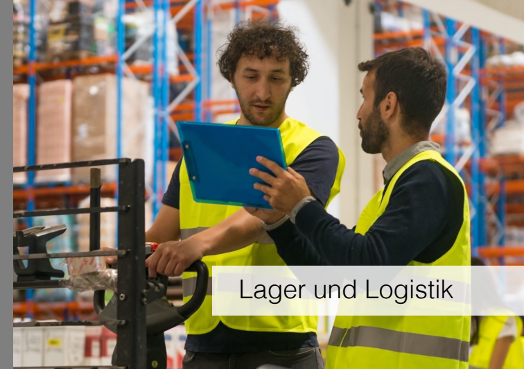
Lager und Logistik